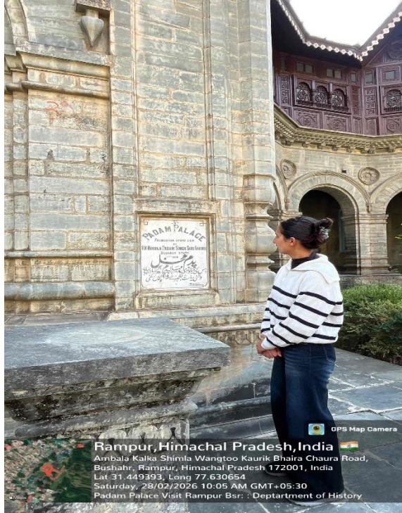
Rampur, Himachal Pradesh, India Ambala Kalka Shimla Wangtoo Kaurik Bhaira Chaura Road, Bushahr, Rampur, Himachal Pradesh 172001, India Lat 31.449393, Long 77.630654 Saturday, 28/02/2026 10:05 AM GMT+05:30 Padam Palace Visit Rampur Bsr: : Department of History