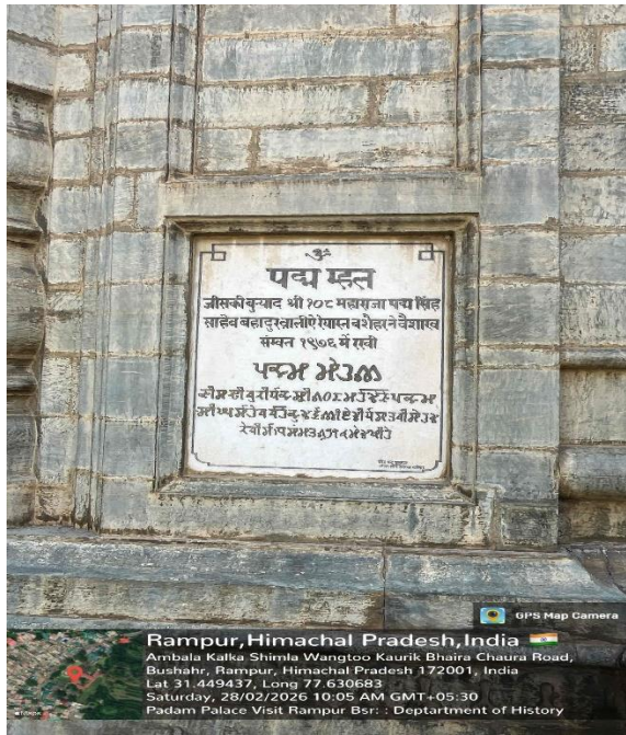
Rampur, Himachal Pradesh, India Ambala Kalka Shimla Wangtoo Kaurik Bhaira Chaura Road, Bushahr, Rampur, Himachal Pradesh 172001, India Lat 31.449437, Long 77.630683 Saturday, 28/02/2026 10:05 AM GMT+05:30 Padam Palace Visit Rampur Bsr: : Department of History